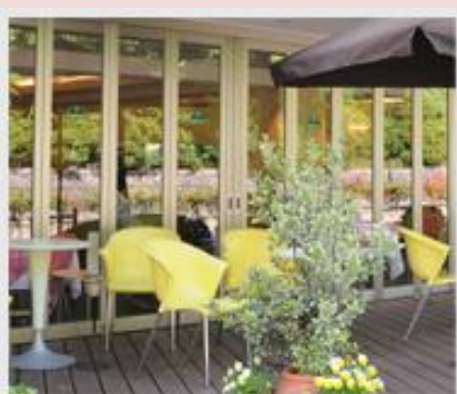
カフェ「フェルマータ」