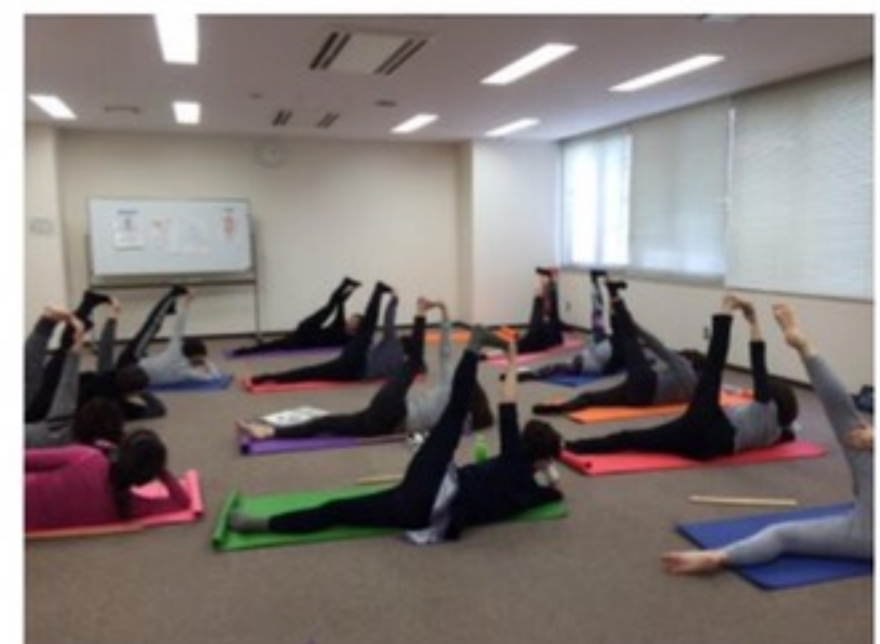
ベーシックコース